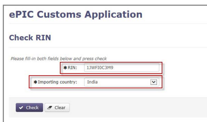
Obrázok 2: Vkladanie údajov

Po vyplnení oboch polí používateľ klikne na tlačidlo „Check“ (Kontrola), aby sa mu načítali údaje. Výsledkom vyhľadávania bude jedna z týchto možností: