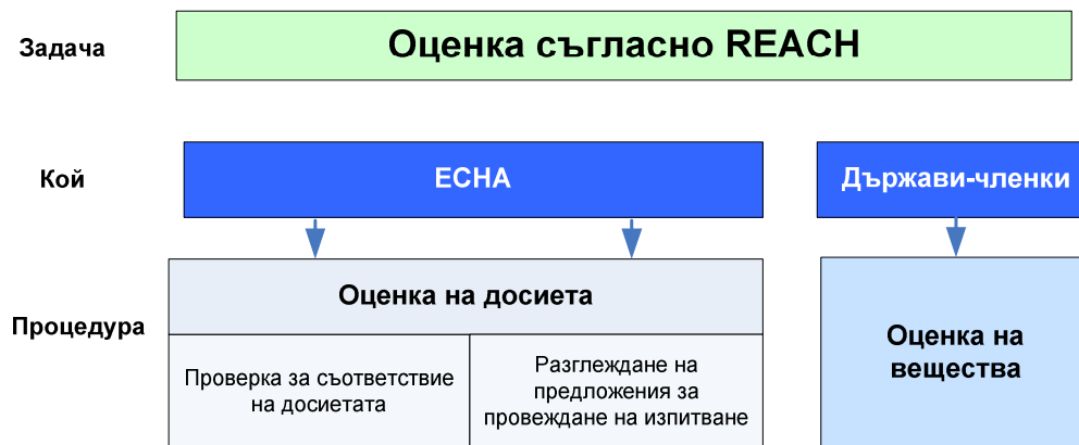
Фигура 1: Оценка съгласно регламента REACH; MSCA = Компетентен орган на държавата-членка

Резултатите от досието и от оценката на веществото водят до по-добро управление на риска на съответните химикали и подпомагат безопасното им използване. Задължението за управление на рисковете и за осигуряване на подходящи мерки за управление на риска се поема основно от регистрантите. Държавите-членки обаче могат да налагат национални действия или да инициират приемане на мерки за управление на риска в рамките на ЕС (напр. ограничения при експозиция в работна среда, ограничение в рамките на ЕС, хармонизирани в рамките на ЕС класифициране и етикетирание).