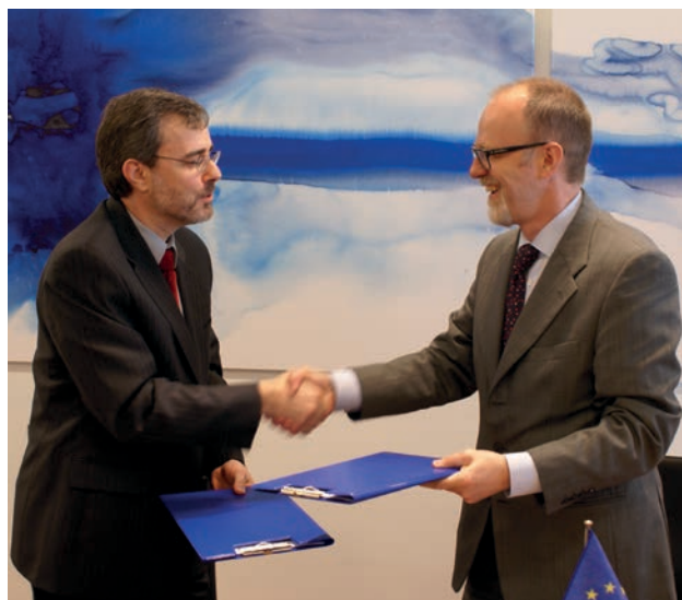
Memorandumul de înțelegere între ECHA și Canada a fost semnat în 2010.

În timp ce politica de extindere a Uniunii Europene se adresează țărilor candidate și potențial candidate pentru aderarea la UE, PEV este orientată către angajarea celor 16 țări situate la granițele externe imediate ale Uniunii. ECHA a contribuit la ambele domenii de politică în ceea ce privește apropierea, aplicarea și asigurarea respectării legislației UE.