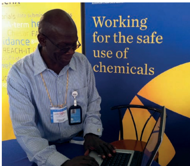
Un participant la întrunirea ICCM-3 studiază site-ul ECHA la standul de informare al agenției din Nairobi.